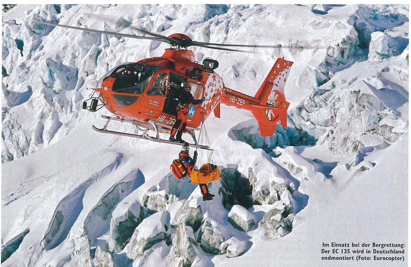
Im Einsatz bei der Bergrettung: Der EC 135 wird in Deutschland endmontiert

gemeinsamer Lieferantenentwicklungsprozess (Supplier Development Process) angeschlossen, der eine mittel- bis langfristige Verbesserung auf beiden Seiten zum Ziel hat.